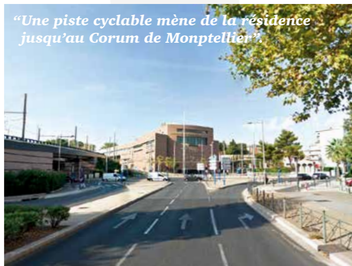
“Une piste cyclable mène de la résidence jusqu’au Corum de Montpellier”.