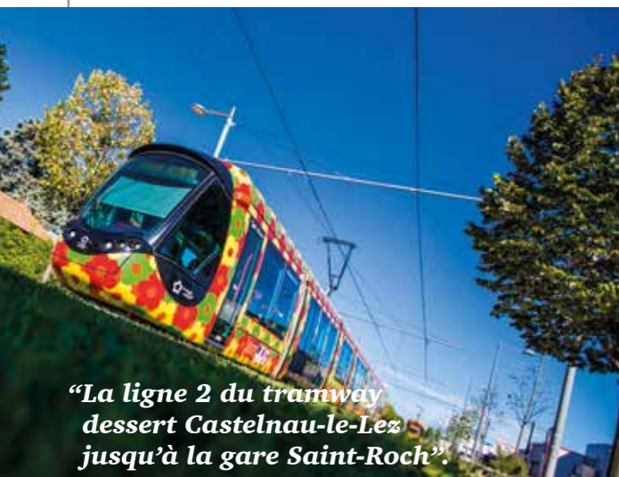
“La ligne 2 du tramway dessert Castelnau-le-Lez jusqu’à la gare Saint-Roch”.